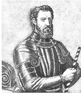
Giovanni da Verrazzano scopritore del Nord America nato nel Castello di Verrazzano nel 1485